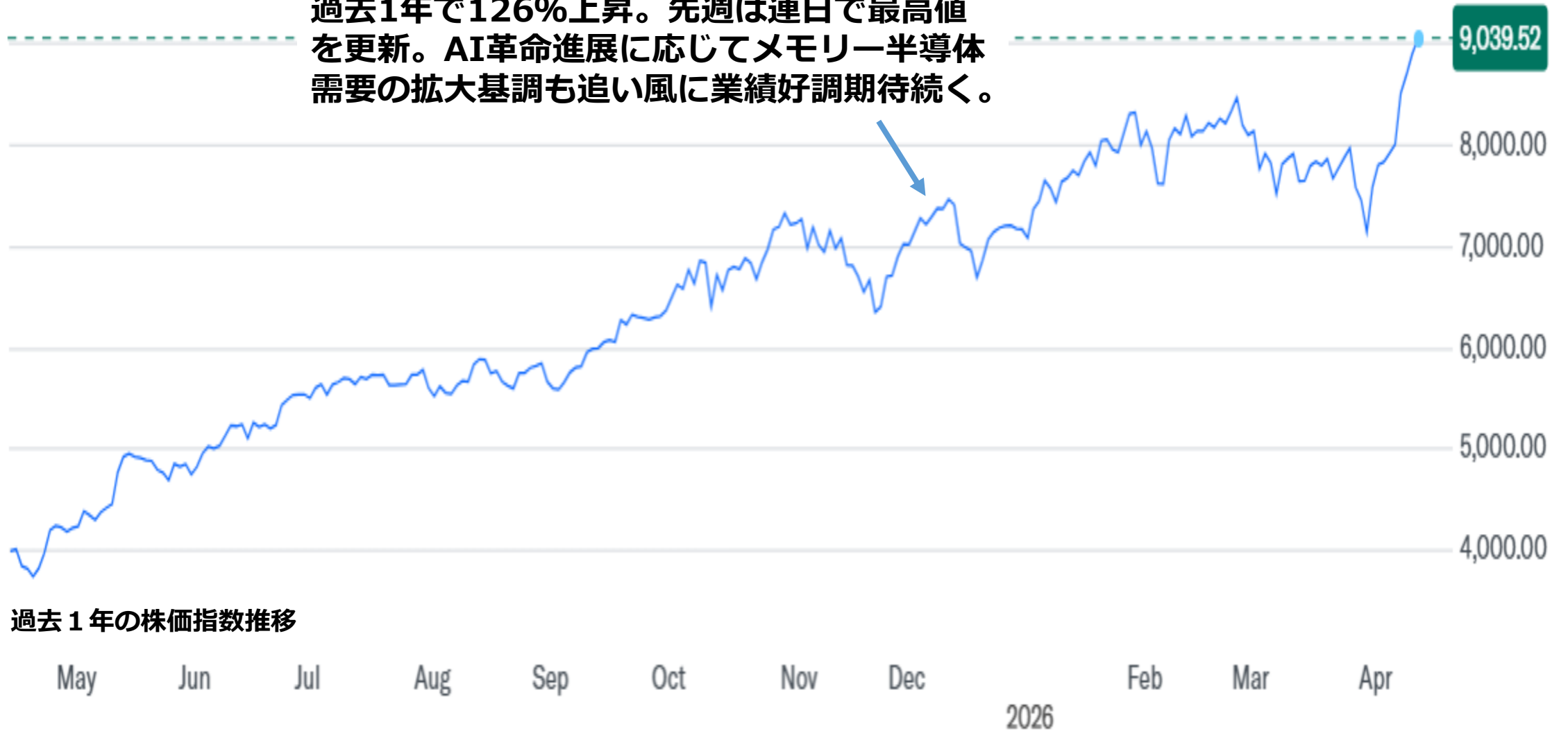
過去1年の株価指数推移

フィラデルフィア半導体株価指数（SOX）は過去1年で126%上昇。先週は連日で最高値を更新。AI革命進展に応じてメモリー半導体需要の拡大基調も追い風に業績好調期待続く。