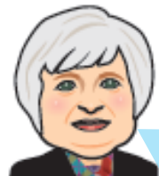
ジャネット・イエレン