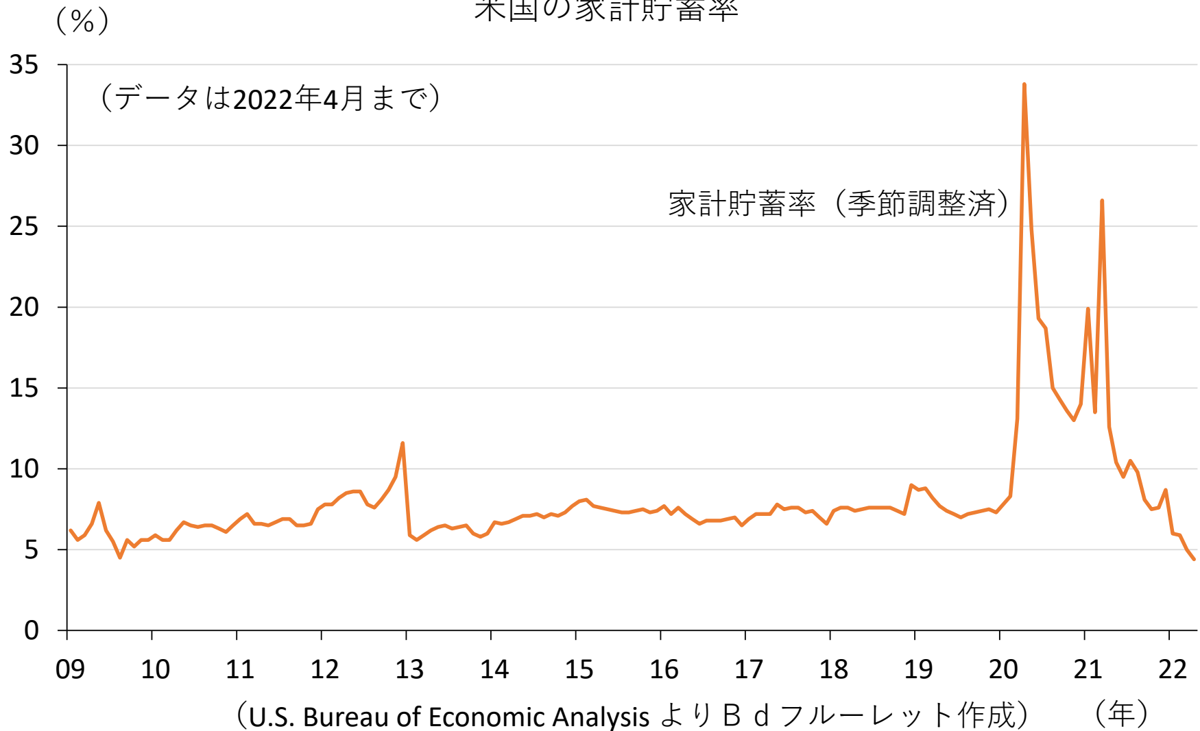
米国の家計貯蓄率