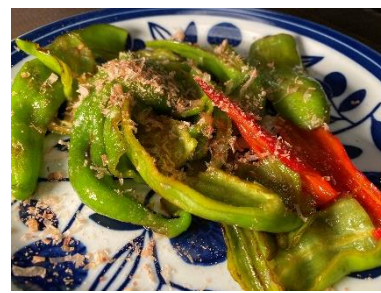
10月20日 「万願寺唐辛子の炒めもの」